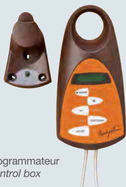
Programmateur Control box